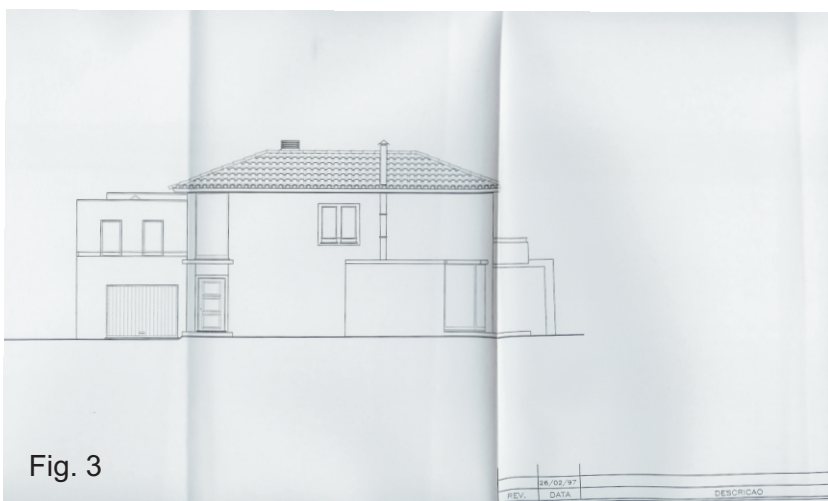
Fig. 1,2,3 - Plantas minha casa actual